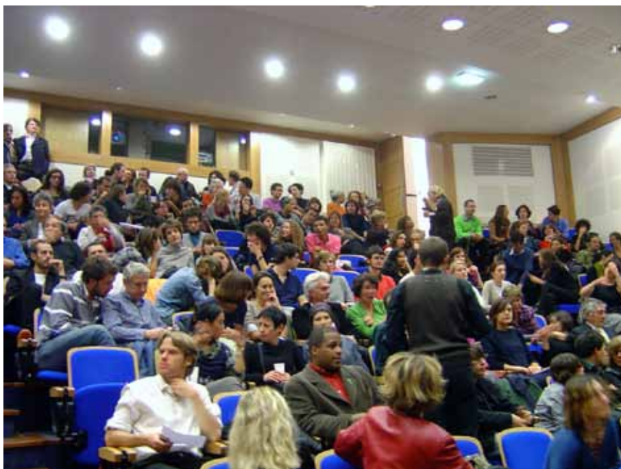
La « Nuit américaine », organisée le soir de l'élection présidentielle 2008.